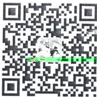
农业银行信用卡微信服务号

卡”——“申请进度查询”；或者“农业银行信用卡”微信小程序，选择“信用卡申请—申请进度查询”。