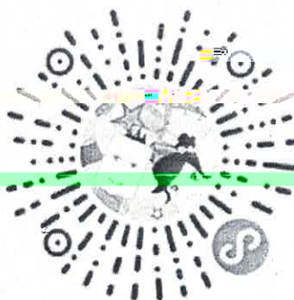
农业银行信用卡小程序